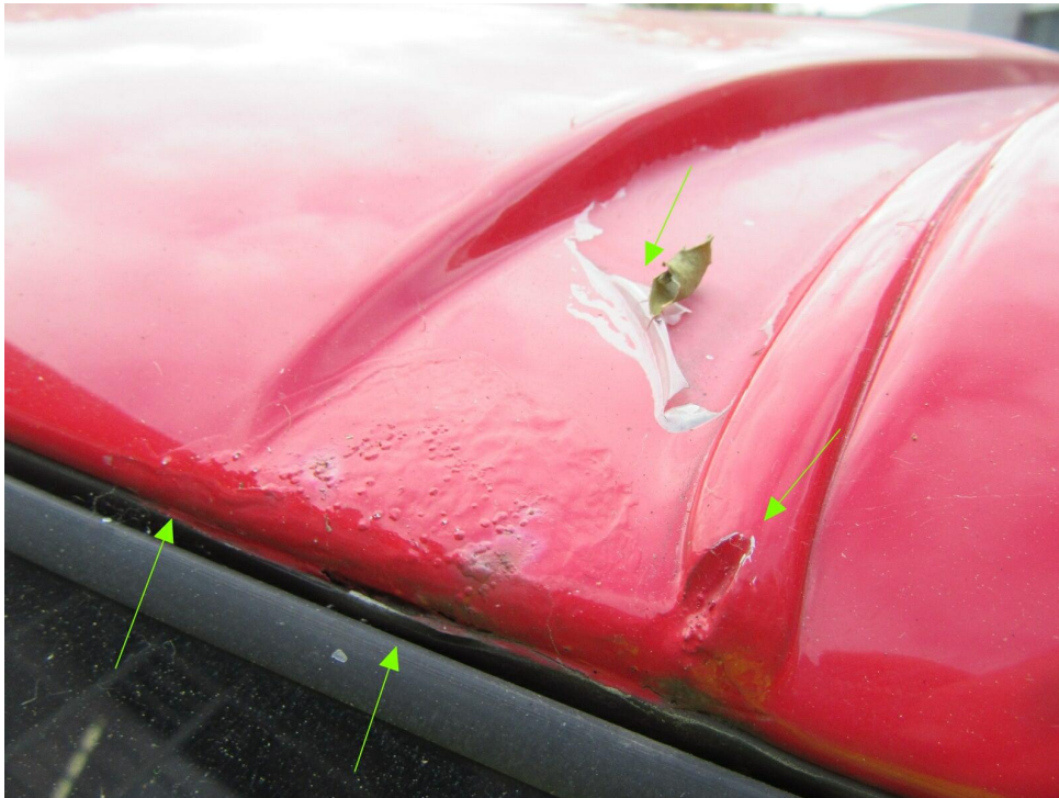
Bild 13 : Das Fahrzeugdach zeigt im vorderen Bereich korrosionsansätze und Klarlackablösungen