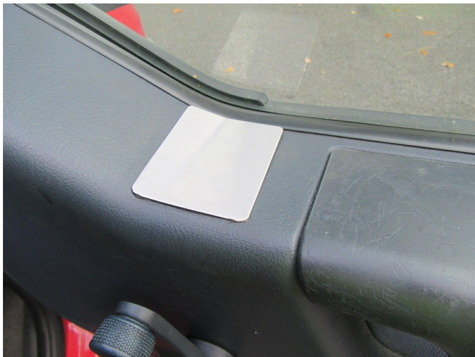
Bild 16 : Die Abdeckungen der Fensterheber wurden mit einem Blech verschlossen