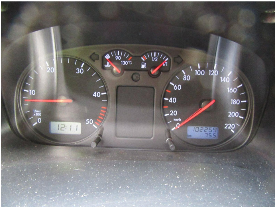
Bild 4 : Kombiinstrument Kombiinstrument mit aktuellem Kilometrstand