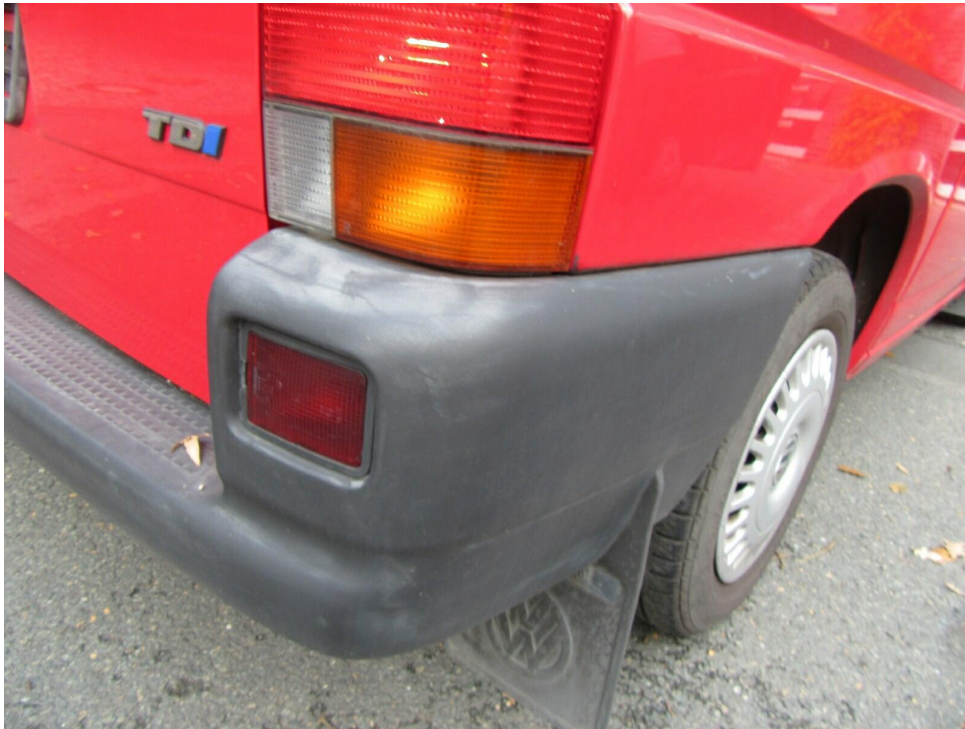
Bild 17 : Die Heckstoßfängerverkleidung zeigt deutliche Gebrauchsspuren